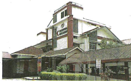
BANGUNAN Hospital Machang.

Selepas dibuka pukul 8 pagi, kami antara orang terawal mendaftar terpaksa menunggu hampir sejam sebelum dirujuk