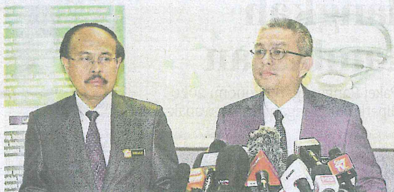
Dr Adham pada sidang media harian mengenai perkembangan situasi COVID-19 di Kuala Lumpur, semalam.

Katanya, kira-kira 7,000 peserta perhimpunan tabligh yang diadakan di Masjid Seri Petaling setakat ini sudah ke hospital untuk memeriksa status kesihatan mereka.