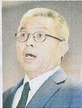
DR ADHAM BABA

Menurut Adham, terdapat pertambahan kes Covid-19 yang ketara