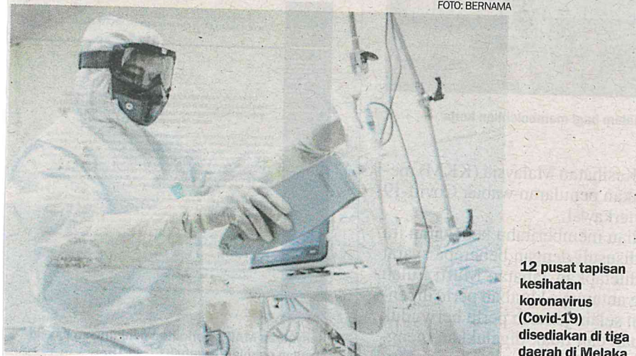
12 pusat tapisan kesihatan koronavirus (Covid-19) disediakan di tiga daerah di Melaka.