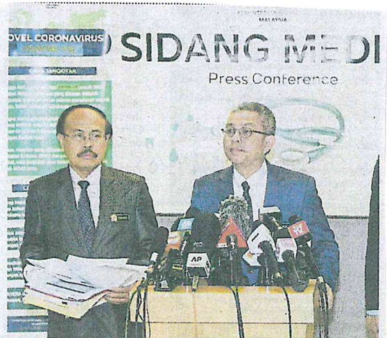
Health Minister Datuk Dr Adham Baba speaking at the Health Ministry in Putrajaya yesterday.

"We must focus on treating severe cases in hospitals. Mild cases and patients without symptoms should be placed in special areas