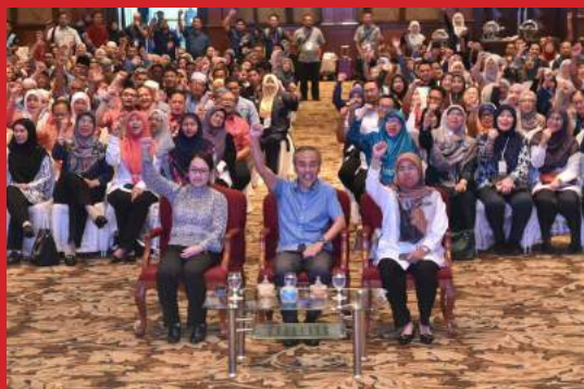
PERASMIAN KONVENSYEN MYCHAMPION@KKM PERINGKAT KEBANGSAAN 2023