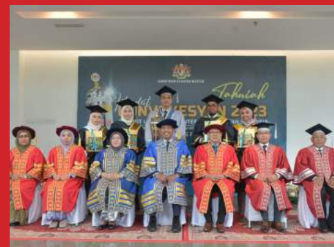
ISTIADAT KONVOKESYEN INSTITUT LATIHAN KEMENTERIAN KESIHATAN MALAYSIA (ILKKM) 2023