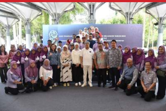
MAJLIS PERASMIAN SAMBUTAN HARI WARGA EMAS SEDUNIA