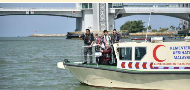
Perasmian Bot Ambulans Klinik Kesihatan Pulau Redang dan Klinik Kesihatan Pulau Perhentian