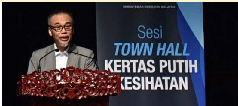
Sesi Town Hall Kertas Putih Kesihatan